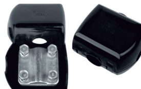
Крюк 5301 в КУ1301