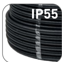
Степень защиты IP55

Гофрированные трубы FRHF не содержат в своем составе галогенов, вредных для здоровья человека, производятся из высококачественного негорючего композита и не распространяют горение. Рекомендованы к применению в местах массовых скоплений людей.