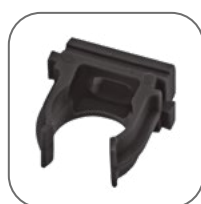
Все необходимые аксессуары